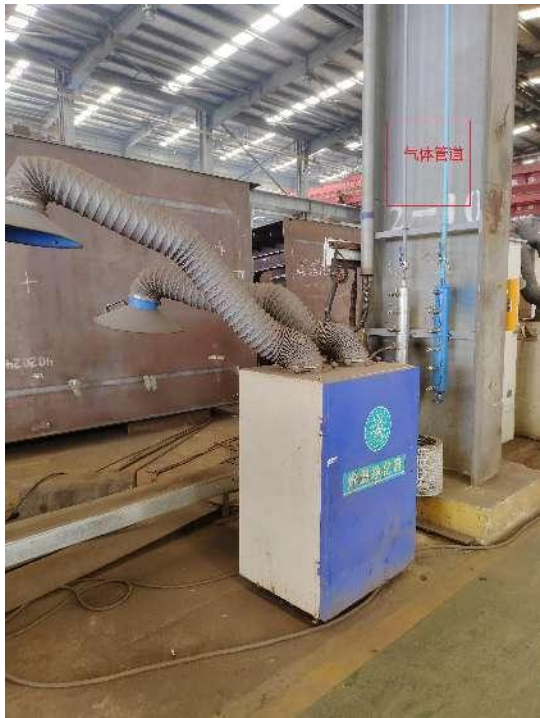
移动式焊烟净化器和集气罩