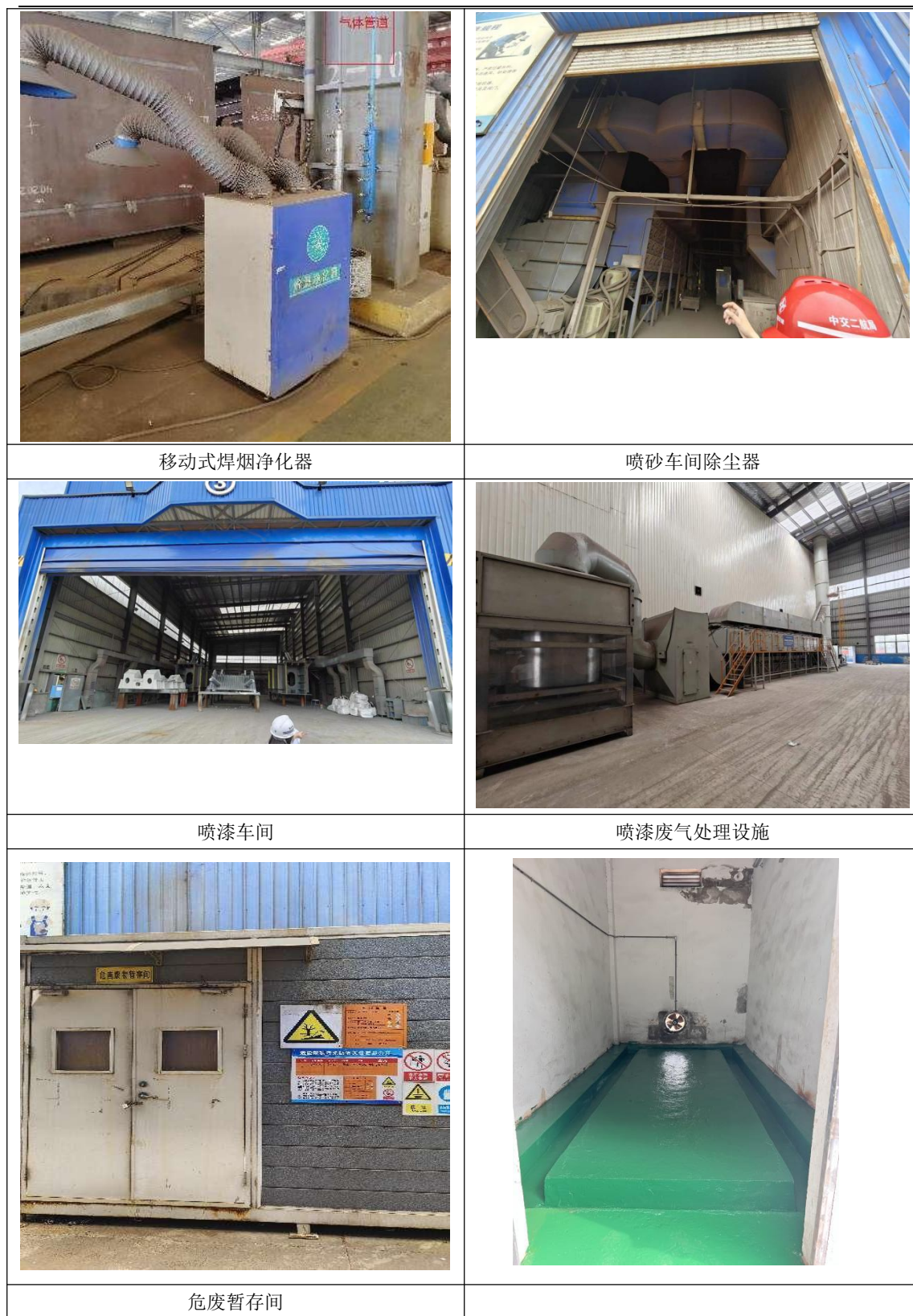
图 3-1 环保设施相关照片