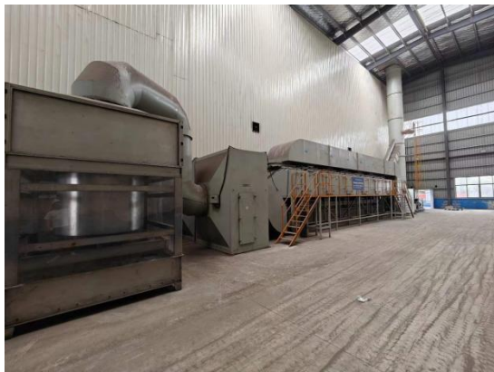
喷漆废气处理设施